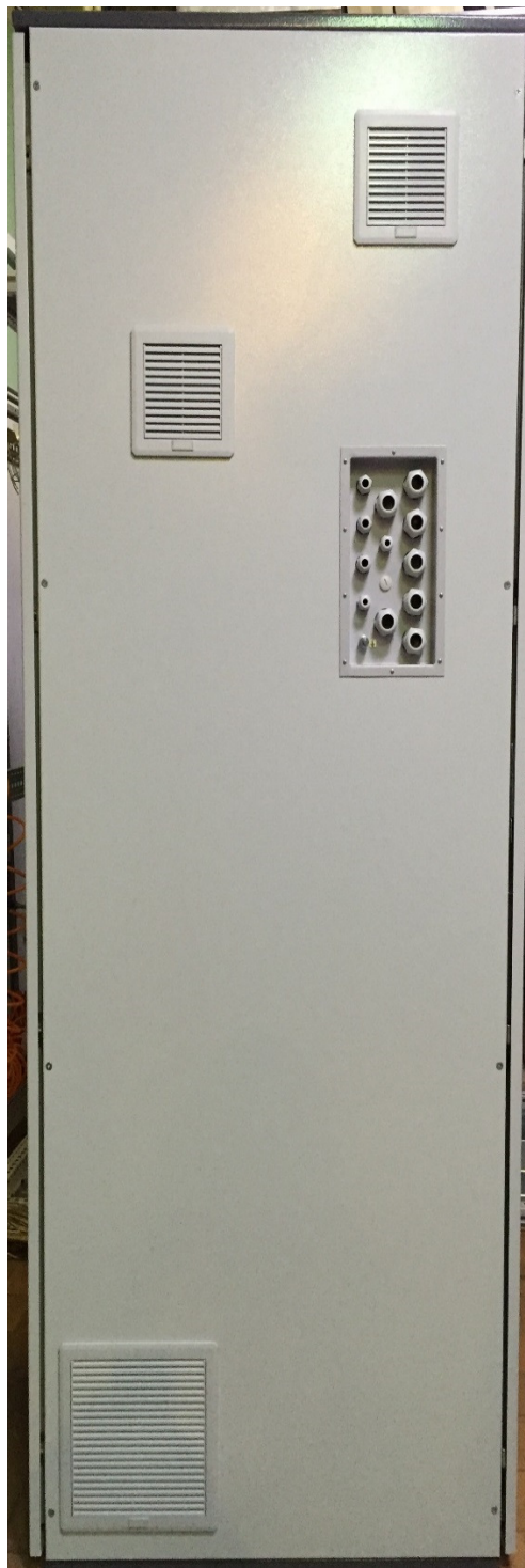
б) вид с боку