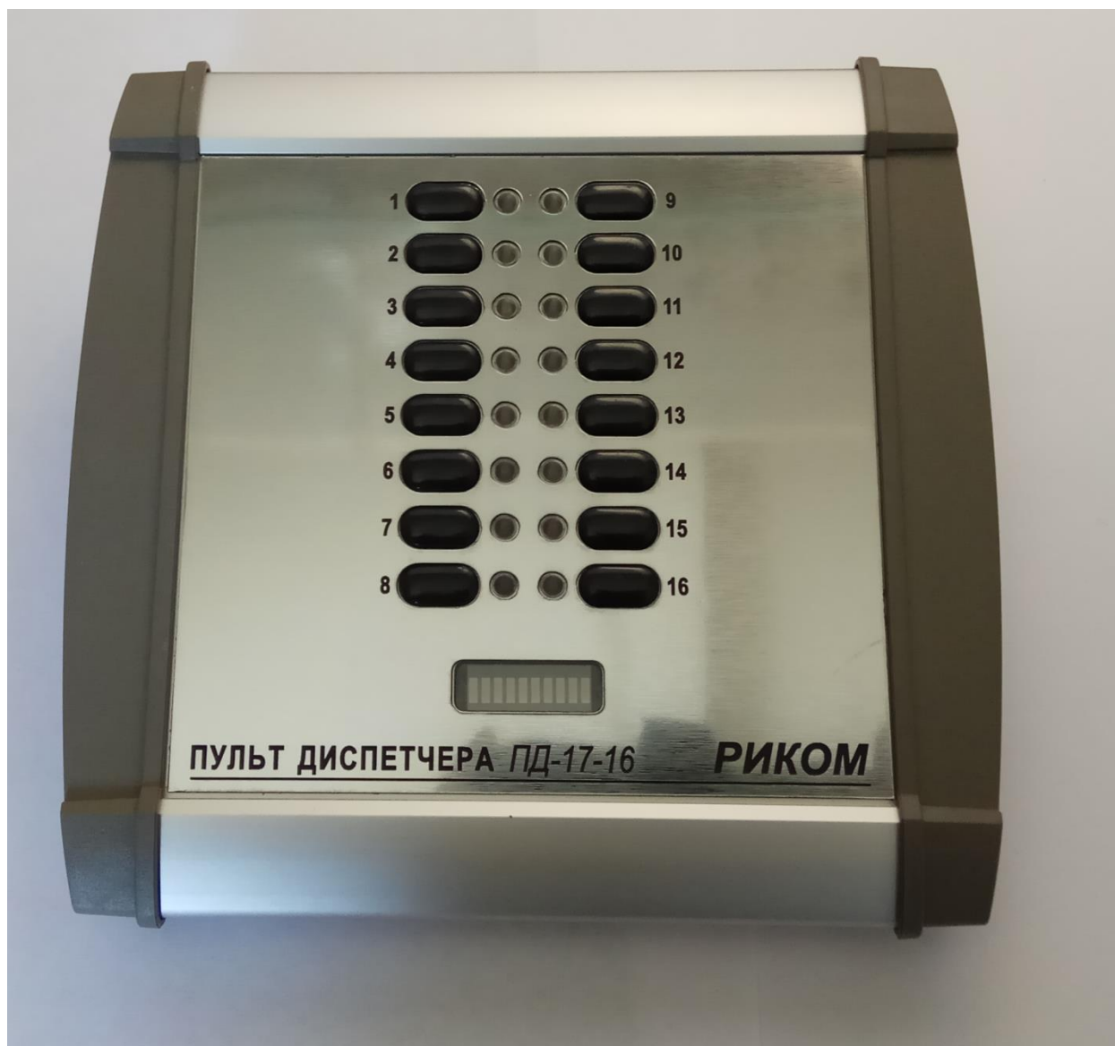
Рисунок 1.2 – Внешний вид пульта ПД-17-16