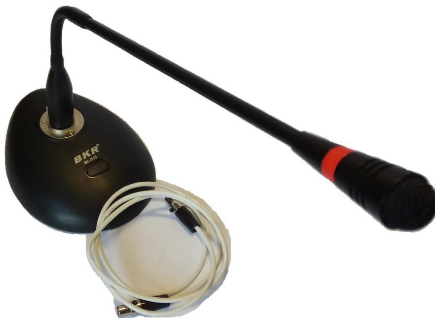
Рисунок 1.1 – Внешний вид микрофона